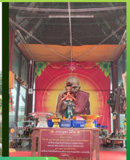
รูปปั้นตาไข่ ในศาลากลางน้ำ