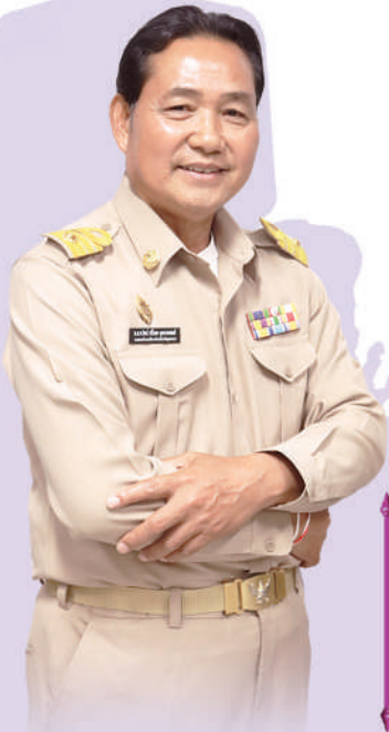
พ.ต.ท.ดร.จิตต์ ศรีโยหะ มุกดาร์นพงษ์